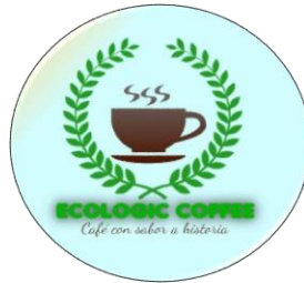
Figura 2. Logotipo de la empresa