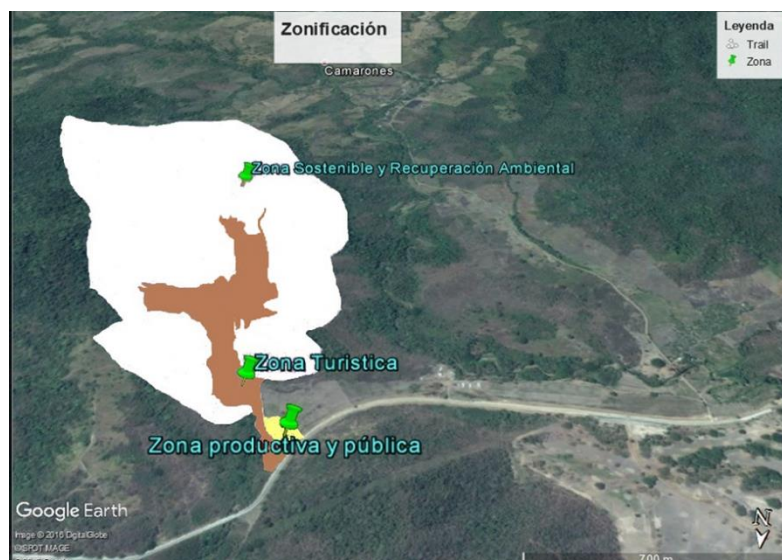
Figura 1. Zonas de manejo